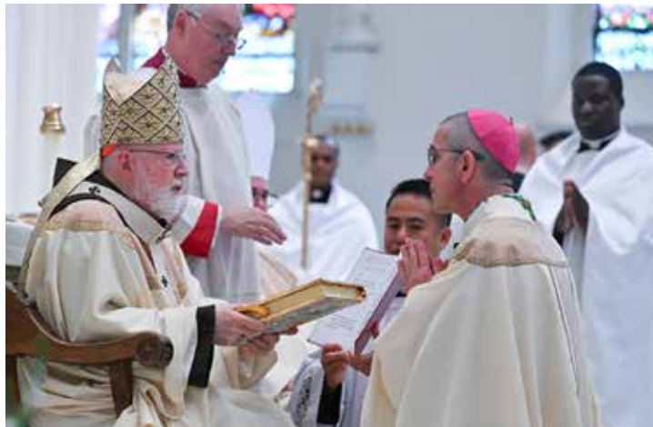
El cardenal Sean O'Malley y el obispo James Ruggieri durante la Misa de ordenación de Ruggieri en Portland, Maine, el 7 de mayo de 2024.

https://www.catholicworldreport.com/2024/05/10/new-bishop-ordained-in-portland-maine-a-franciscan-shepherd-for-the-people/