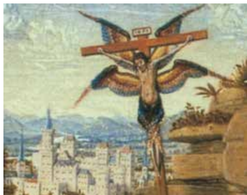
The Seraph-Christ seen by St. Francis when he received the stigmata.

Según la Tercera consideración sobre las estigmas, en las Florecillas de San Francisco (los Fioretti), Francisco rezó por dos gracias: sentir en su cuerpo el dolor que Jesús sintió durante su Pasión y conocer en su corazón el amor que Jesús sintió por toda la humanidad.