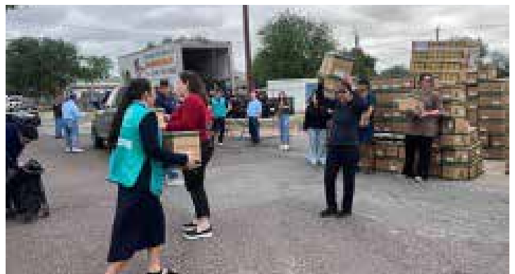
San Felipe de Jesus Fraternity in Laredo, Texas, participating in a Catholic Charities food drive as a Lenten apostolate.

Mi madre enseñó a nuestra familia a cantar eso como un canto espiritual. Lo tengo en el tronco de mi cerebro, muy profundo. Si nos preocupamos cuando alguien siembra la discordia demonizando a los inmigrantes o a otros grupos, podemos recordar ese pasaje. Si nos entregamos al servicio juntos, permaneceremos verdaderamente en amor. Seremos uno en la misericordia de Dios y nos sentiremos elevados sobre las alas de las águilas.