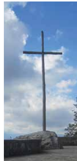
The cross at La Verna

Cierta mañana de un día cercano a la fiesta de la Exaltación de la Santa Cruz, mientras oraba en uno de los flancos del monte, vio bajar de lo más alto del cielo a un serafín que tenía seis alas tan ígneas como resplandecientes. En vuelo rapidísimo avanzó hacia el lugar donde se encontraba el varón de Dios, deteniéndose en el aire. Apareció entonces entre las alas la efigie de un hombre crucificado, cuyas manos y pies estaban extendidos a modo de cruz y clavados a ella... Así sucedió, porque al desaparecer la visión dejó en su corazón un ardor maravilloso, y no fue menos maravillosa la efigie de las señales que imprimió en su carne.