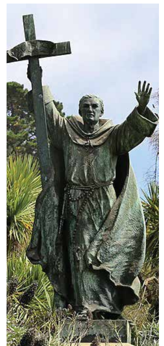
San Junípero Serra Apóstol de California

La región es culturalmente diversa, con cuatro fraternidades hispanas, dos coreanas y una china, la única del país.