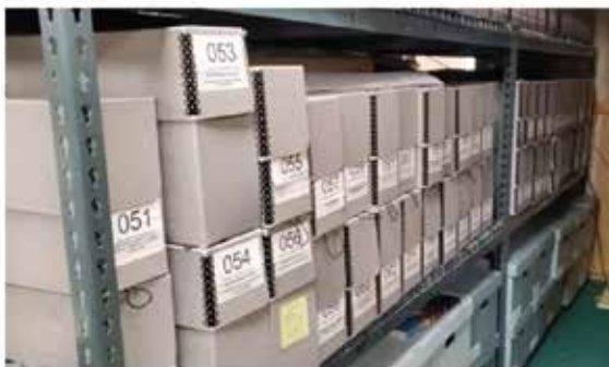
Cajas de almacenaje bien organizadas.