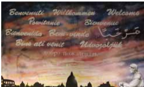
Bienvenido a Roma

"Tú eres amor", fue el tema del XVII Capítulo General de la Orden Franciscana Seglar, celebrado en Roma en noviembre de 2024, durante el VIII Centenario de los Estigmas. Esta idea fue ampliada por los compañeros franciscanos con explicaciones de que Dios nos amó primero. Nuestra forma de vida franciscana comienza con el amor. Amor a Dios, amor a uno mismo y amor al prójimo y a nuestras familias. Se compartieron testimonios y ejemplos. Se elevó nuestro nivel de preocupación por las fraternidades en dificultades y por las personas marginadas de todo el mundo.